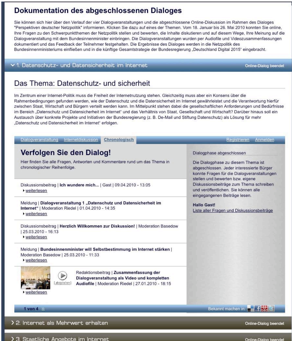
Abb.4: Bildschirmfoto Detailseite „Dokumentation“

Unter dem Menüpunkt „Dokumentation“ wurden die Ergebnisse der vorangegangenen Dialogphasen (18. Januar bis 26. Mai 2010) präsentiert. Thematisch strukturiert konnten sowohl die Videodokumentation als auch die Internetdiskussion abgerufen werden.